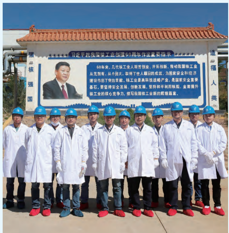
挂职人员赴涪源核电进行安全生产标准化交流