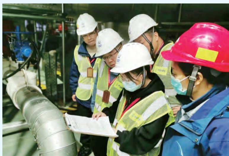
中核兰州挂职人员在福清核电开展现场交流

关山千万重，壮士披荆行。统筹安全和发展是核工业永恒的课题。安全质量管理提升“结对子”工作，是中核集团落实习近平总书记关于安全生产重要指示批示精神的具体实践，是开创新安全格局的积极探索，是“有效协同才能创造更大价值”的现实体现。十年树木，棵棵相连终成林。踏上新征程、步入新的赶考之路，中核集团将继续大力协同，坚持优势互补、资源共享、文化赋能，树牢安全质量管理“一盘棋”思想，不断健全核安全责任体系，为实现中国式现代化奠定强核基石。