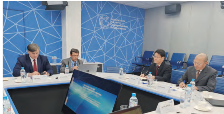
江苏核电拜访白俄罗斯战略研究所