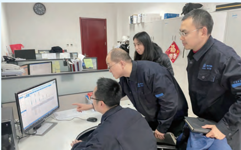
挂职人员开展设备管理领域交流