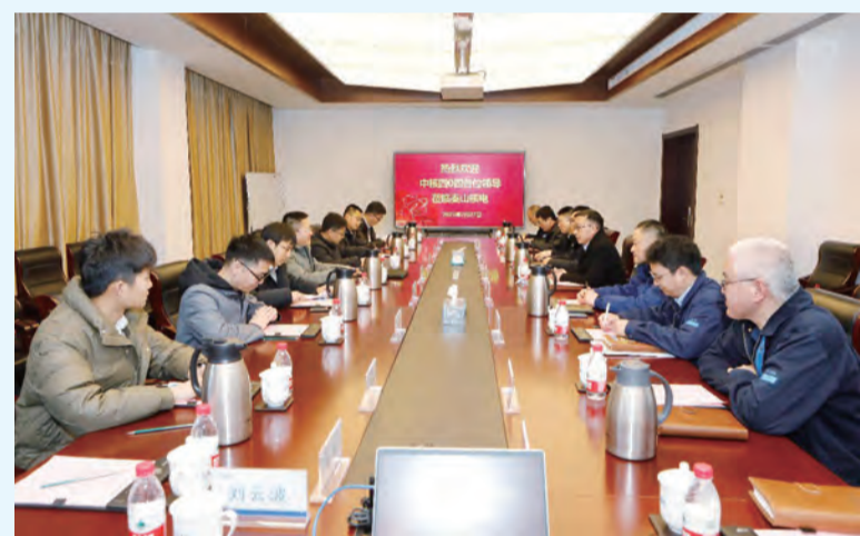
中核四〇四人员在秦山核电开展管理交流