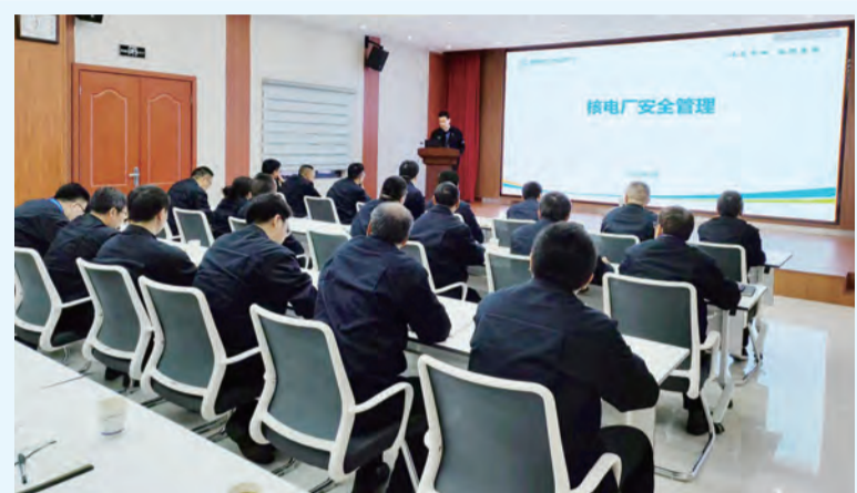
挂职人员讲授安全课